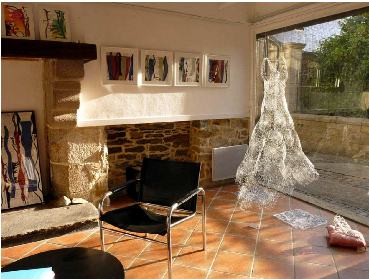
Exposition « Au fil des lignes » : Corinne Cuenot / Sarah Wiame