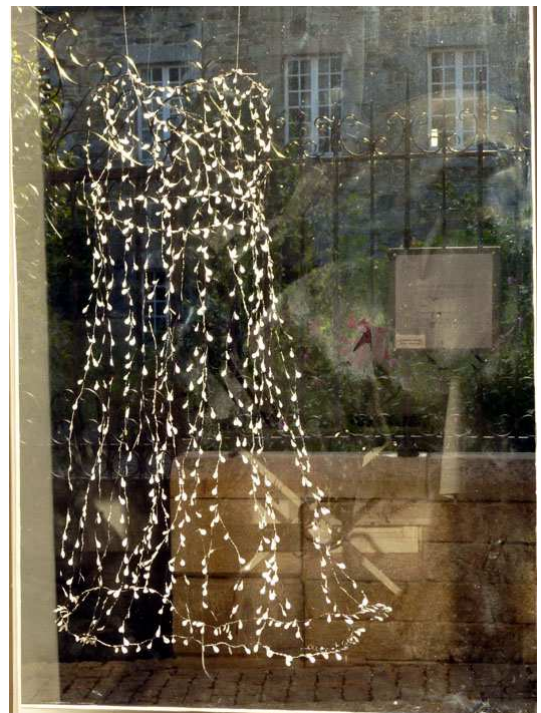
© Corinne Cuenot, "Robe de pluie"