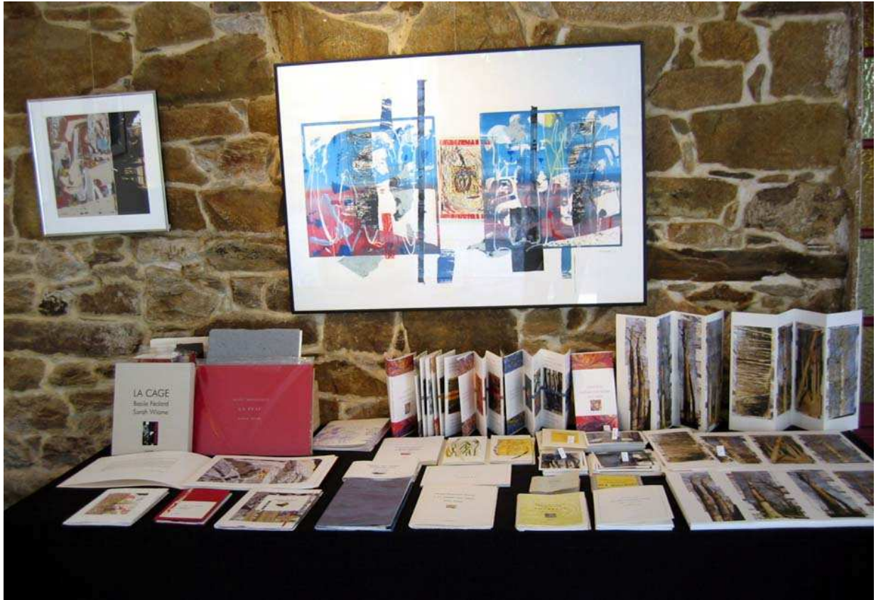
Exposition « Au fil des lignes » : Corinne Cuenot / Sarah Wiame