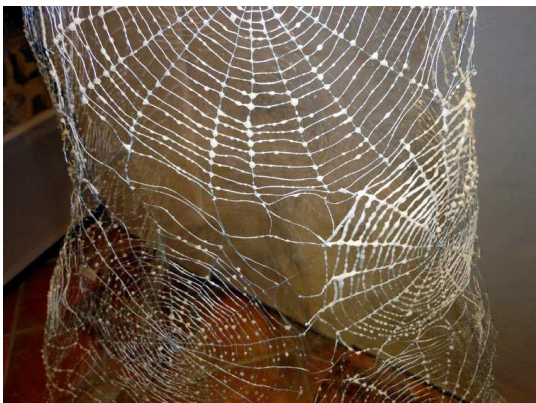
© Corinne Cuenot, "Robe de rosée", détail. Fil d'acier, cire d'abeille