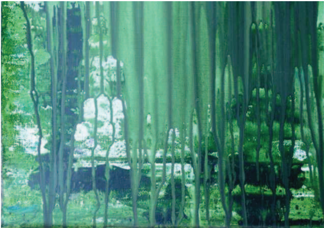
Oriflamme « Vert » . Détail. Huile sur toile

Dernière exposition personnelle mai 2010 : Abbaye de Bonport 27340 Pont de l'Arche Ses œuvres sont recherchées par des collectionneurs